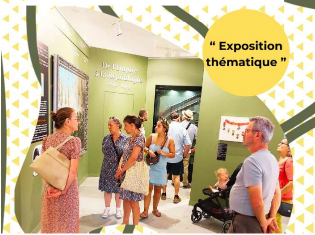
“ Exposition thématique ”