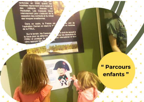
“ Parcours enfants ”