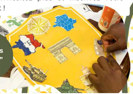
“ Ateliers créatifs ”

Alors n'hésitez plus et inscrivez votre enfant !