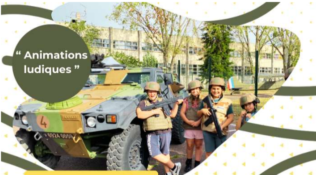
“ Animations ludiques ”