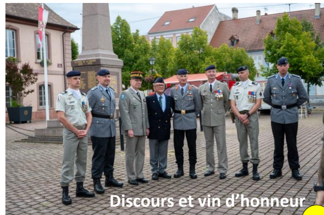
Discours et vin d'honneur