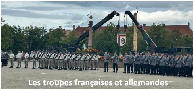
Les troupes françaises et allemandes

La cérémonie, particulièrement complexe, peut alors se dérouler avec des remises réciproques de médailles et de lettres de félicitations, quelques brefs discours en allemand et en français, des transferts officiels de commandement ... et enfin un changement d'étendard, pour la partie française, l'ancien du 14 ème RCS étant remplacé par celui du 5 ème RCS.