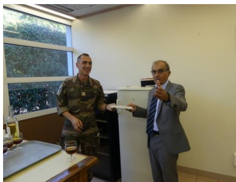
Echange de cadeaux

Après le Kir-apéritif de tradition, les échanges de cadeaux, les discours du Commandant en second et du Président de la FNT, un déjeuner de l'amitié de grande qualité servi dans la salle du Chef de corps a été l'occasion de partager un très bon moment de convivialité.