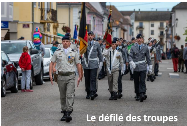
Le défilé des troupes

Après tous ces efforts et beaucoup d'émotions, une photo de famille est nécessaire, avant le défilé des troupes