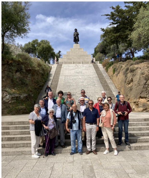
Les participants à l'escapade ajaccienne