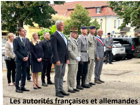
Les autorités françaises et allemandes

La cérémonie, particulièrement complexe, peut alors se dérouler avec des remises réciproques de médailles et de lettres de félicitations, quelques brefs discours en allemand et en français, des transferts officiels de commandement ... et enfin un changement d'étendard, pour la partie française, l'ancien du 14 ème RCS étant remplacé par celui du 5 ème RCS.