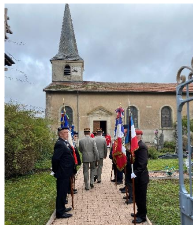
La haie d'honneur des porte-drapeaux